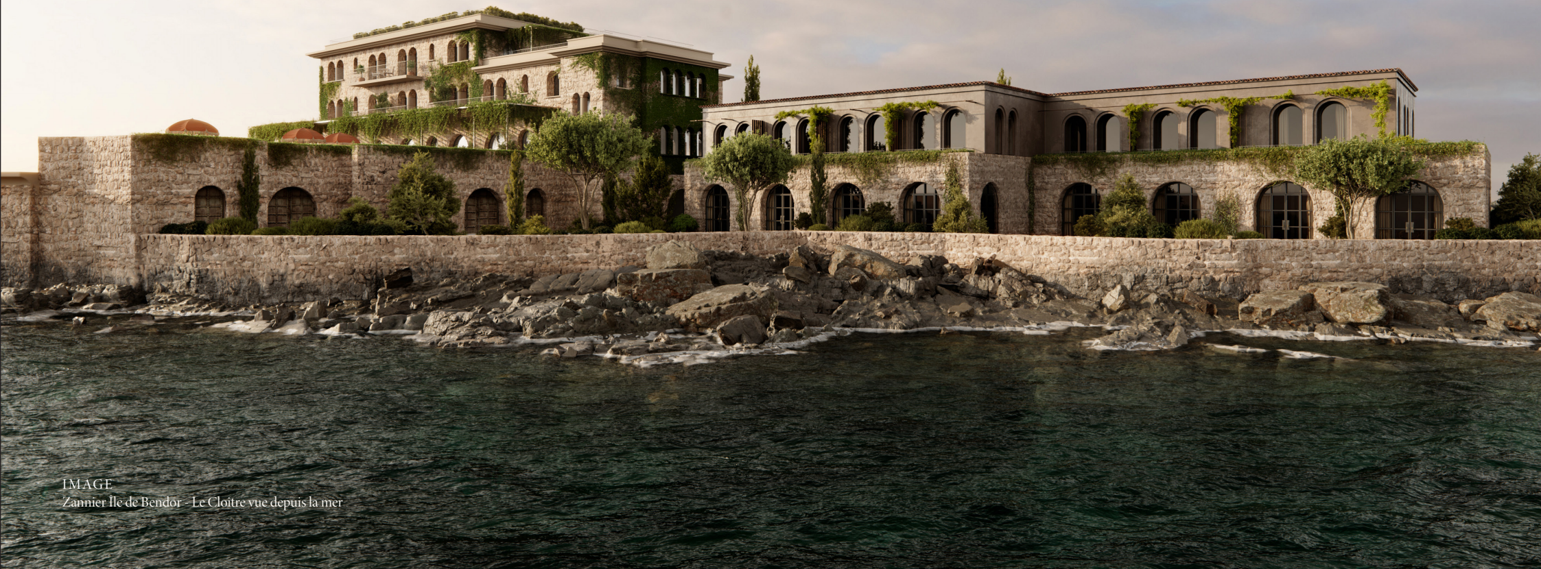
IMAGE Zannier Île de Bendor - Le Cloître vue depuis la mer