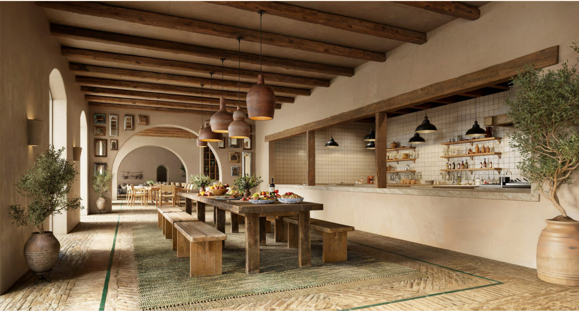
IMAGE Zannier Île de Bendor - Restaurant Nonna Bazaar