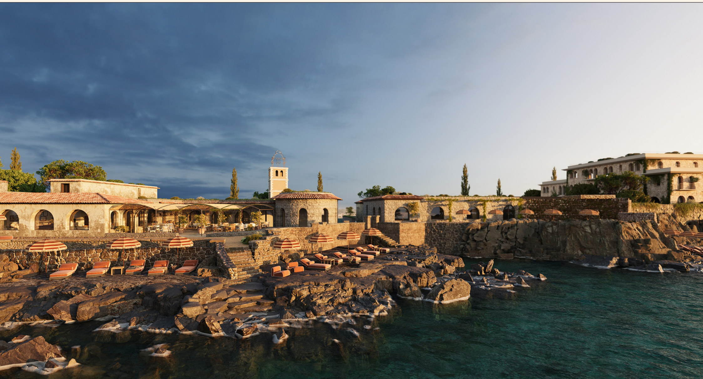
IMAGE Zannier Île de Bendor - Restaurant Le Grand Large