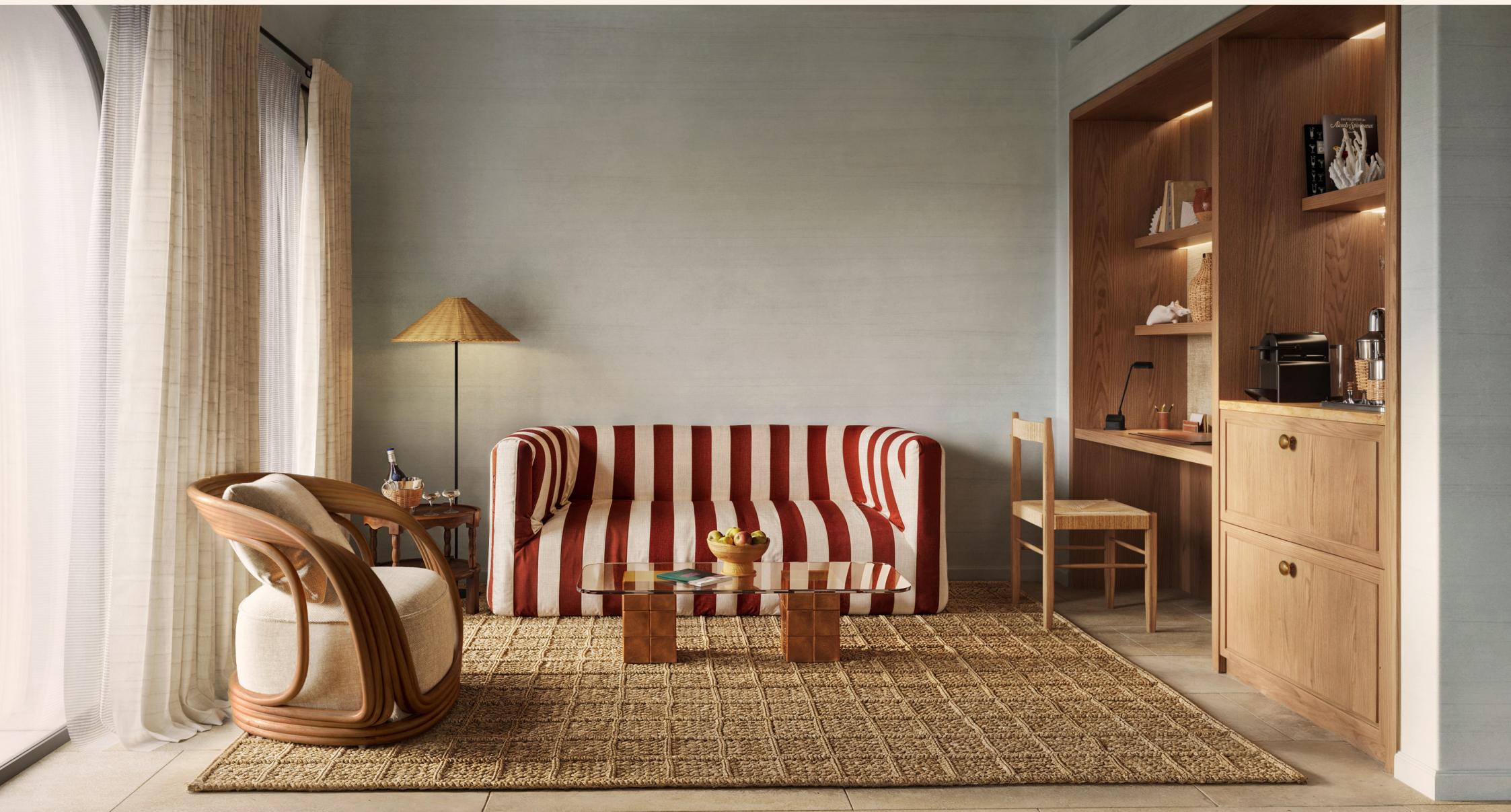
IMAGE Zannier Île de Bendor - Espace Salon d'une Suite vue port