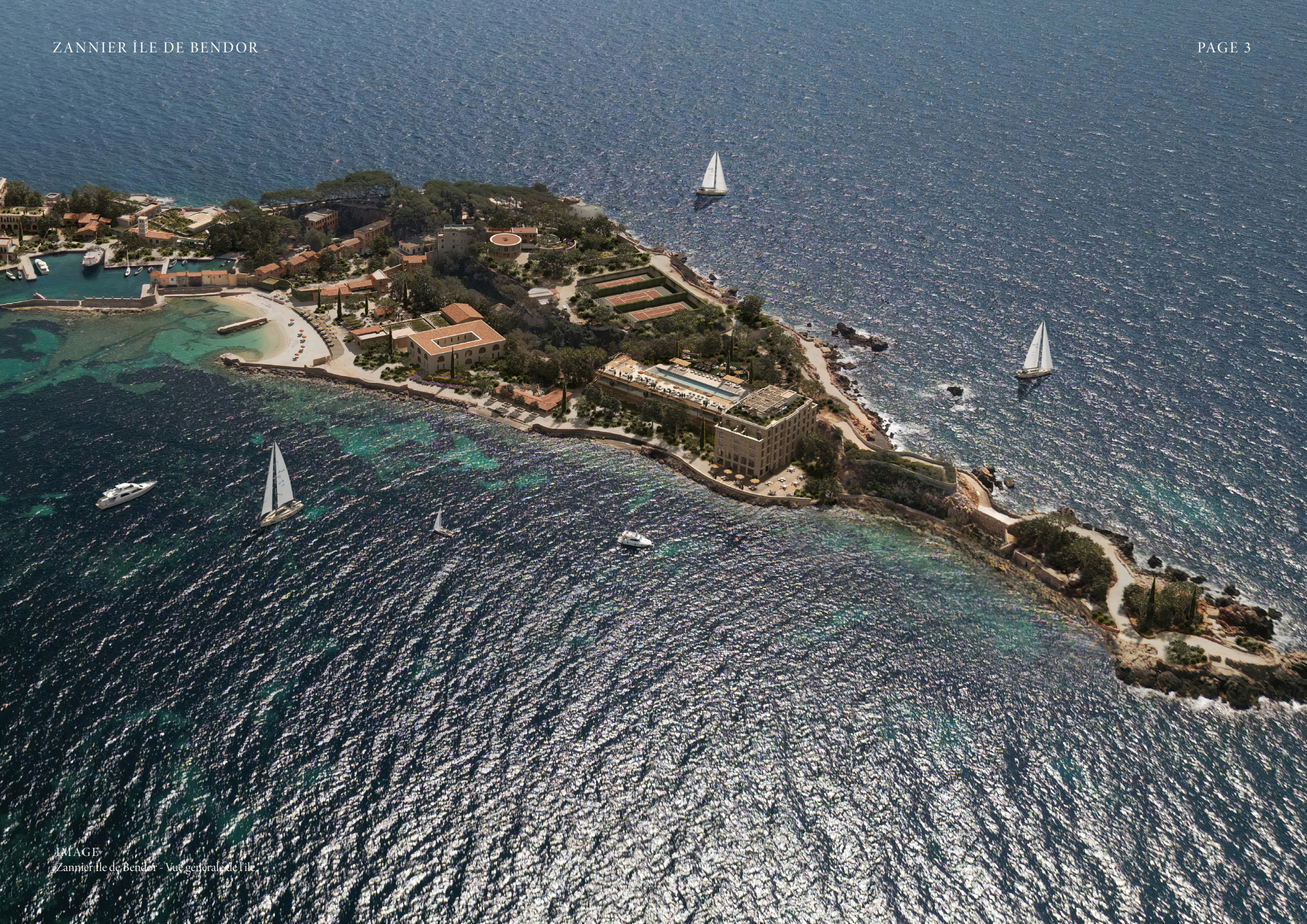
IMAGE Zannier Île de Bendor - Vue générale de l'île